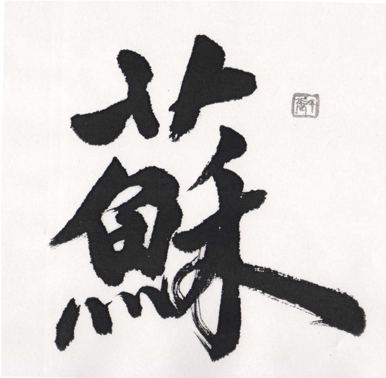
Calligraphy by Xin Zhang